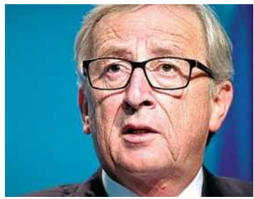
EU-Kommissionspräsident Jean-Claude Juncker

Eine Million Unterschriften bekam EU-Kommissionspräsident Jean-Claude Juncker Anfang der Woche überreicht. Damit protestieren Bürger gegen die Handelsabkommen TTIP (EU/USA) und Ceta (EU/Kanada) – und gegen damit verbundene Gerichte, vor denen Investoren Regierungen verklagen können. Umweltschützer von Friends of the Earth haben berechnet, dass allein nicht geheime Urteile von Schiedsgerichten auf Basis anderer Abkommen EU-Staaten seit 1994 etwa 3,5 Milliarden Euro gekostet haben. PIN