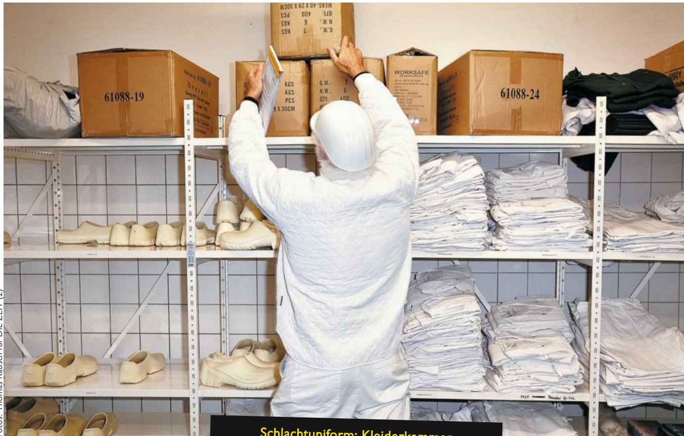
Schlachtuniform: Kleiderkammer in einer deutschen Fleischfabrik