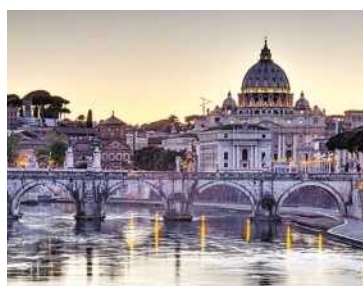
In Rom scheint die Zeit des Vertuschens vorbei zu sein