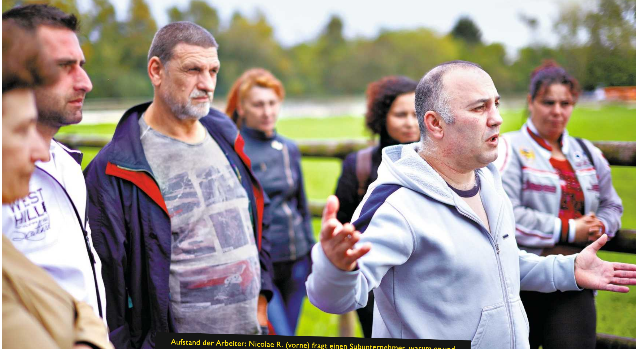
Aufstand der Arbeiter: Nicolae R. (vorne) fragt einen Subunternehmer, warum er und andere Werkvertragsarbeiter ausgebeutet werden

In einer idyllischen Gegend in Niedersachsen wird im Sekundentakt geschlachtet, immer schneller, immer billiger, immer schmutziger. Erledigt wird das Gemetzeln von einer Geisterarmee aus Osteuropa VON ANNE KUNZE