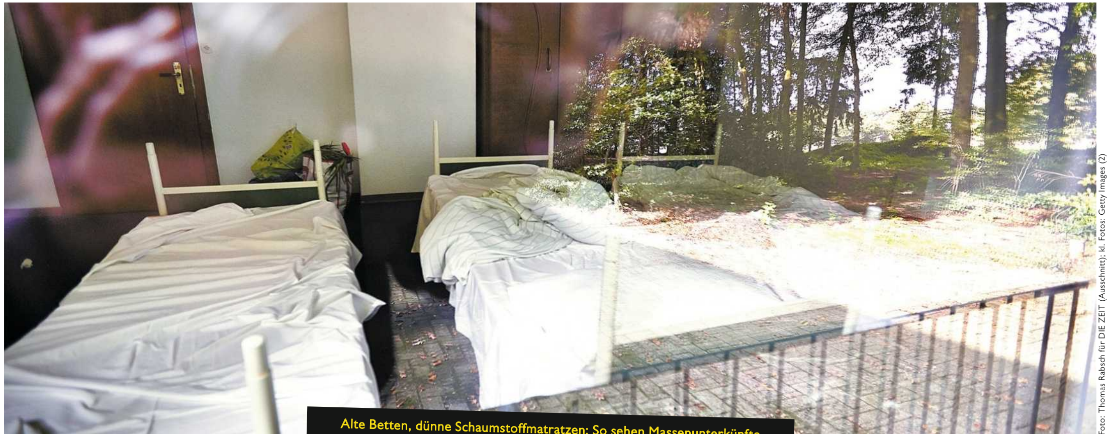
Alte Betten, dünne Schaumstoffmatten: So sehen Massenunterkünfte für Fleischarbeiter in Niedersachsen oft aus